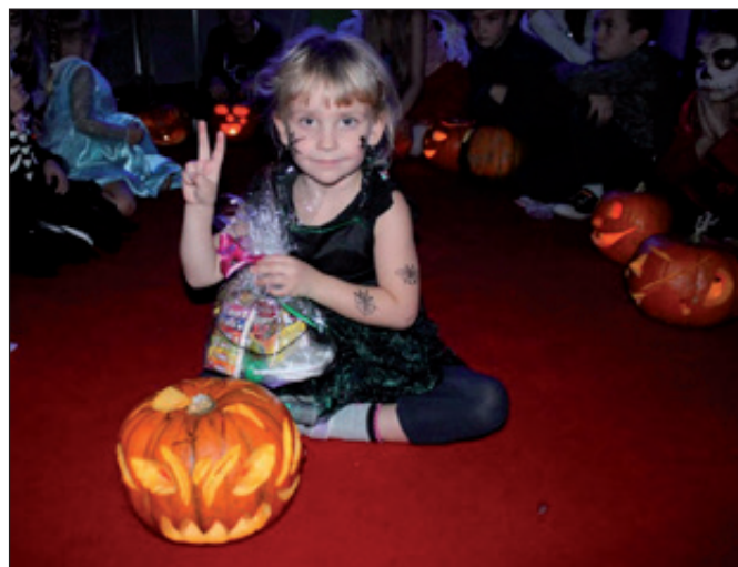
Halloweenské dlabání dýní